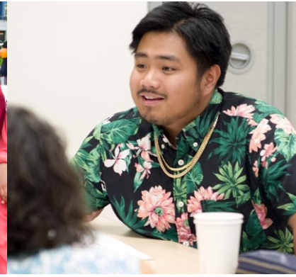
Suuraa (bitaa gara mirgaatti): Haida Roots, Rainier Beach Action Coalition, White Center Community Development Association