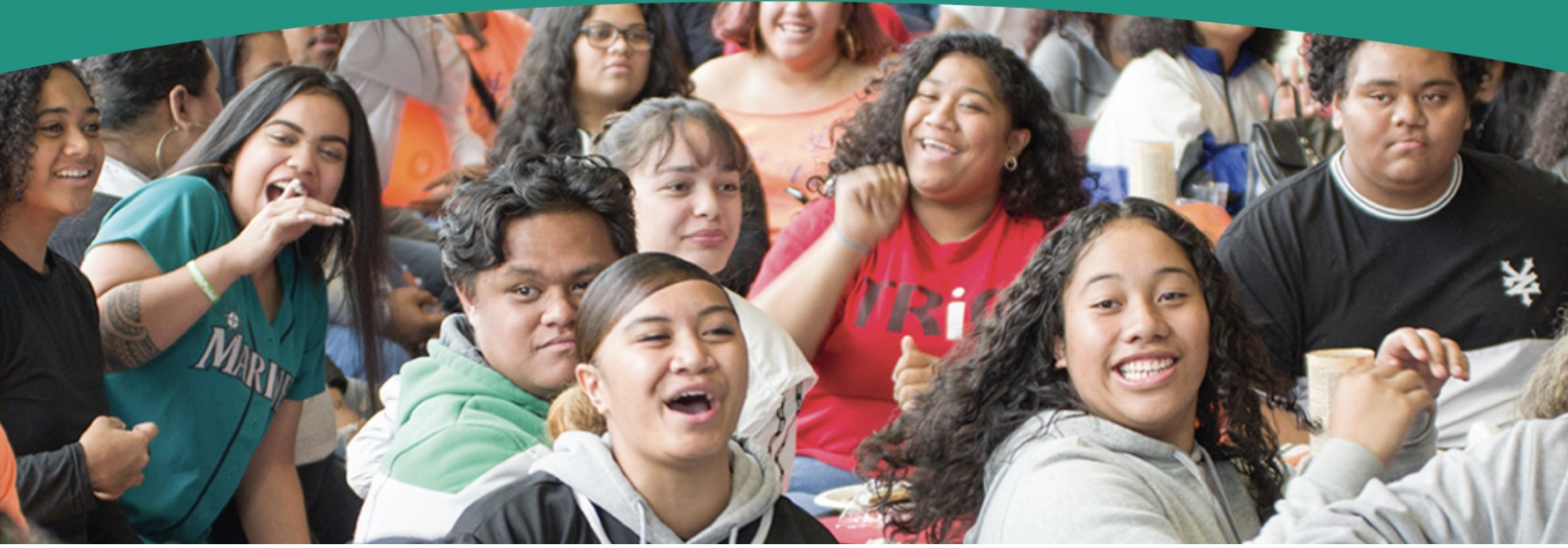
Waa'een Gara fuulduraa Keenyaa Murteessadha.